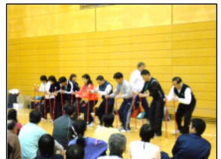
12月に全国伝達講習会を東京で開催しました

宮城県、大阪府、福岡県の3会場では、他県の都道府県本部の認定員資格取得推薦者の参加も受け付けますので、各都道府県本部が実施する認定員伝達講習会に参加できない方は在住都道府県本部の推薦書(書式はありませんが、推薦書と明記し協会名、協会公印を捺印した書類)を参加申込書と合わせて送付してください。