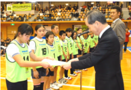
北海道大会の様子